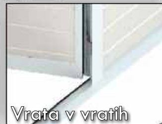
Vrata v vratih