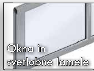
Okna in svetlobne lamele